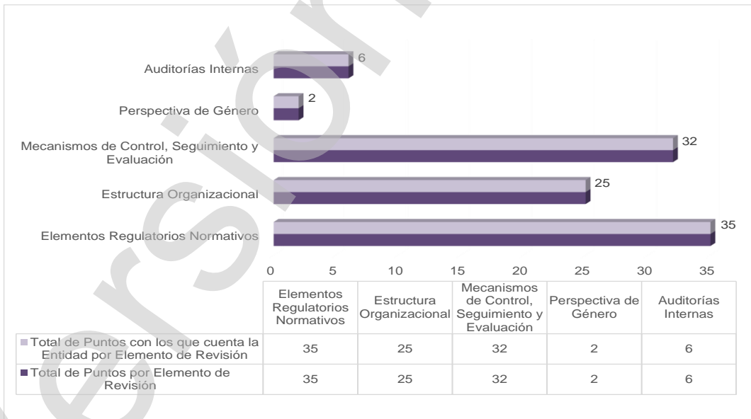
Gráfica 1 Cumplimiento de los Mecanismos de Control Interno Ejercicio 2021